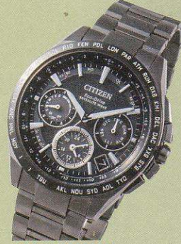
CITIZEN ATTESA シチズン アテッサ

GPS衛星からの時刻情報を世界最速最短3秒で受信するエコ・ドライブ、デュアルタイムやクロノグラフ機能を搭載。¥200,000(シチズンお客様時計相談室)